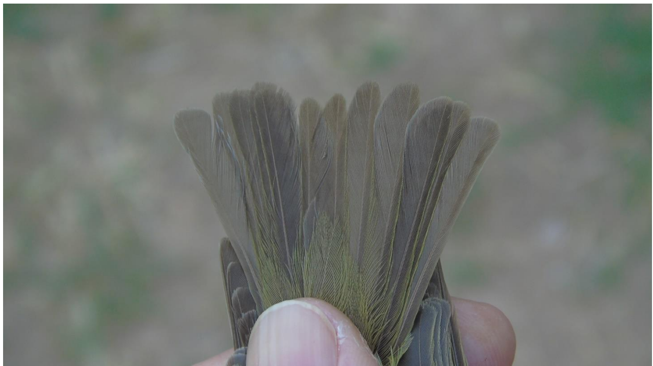
Cola típica de adulto (Toda es prenupcial con puntas anchas y sin plumas retenidas)

La muda prenupcial incluye todo el plumaje. Unos pocos pájaros de primavera muestran algunas plumas en mejores condiciones, pero es probable que esto refleje periodos prolongados de muda durante el invierno. Se conocen raras ocasiones de algunas plumas retenidas.